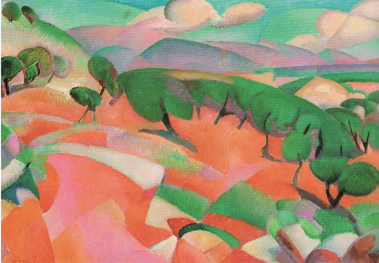
Berghandschap (Mallorca) – (1914)

In de periode vlak voor de Eerste Wereldoorlog schildert Gestel onder meer in en rond Woerden en Nijmegen. In die tijd omarmt hij eerst het pointillisme en later het luminisme , wat uitmondt in schitterende doeken als Herfst , een icoon in Museum Kranenburg in Bergen (NH).