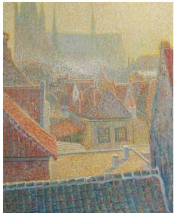
Gezicht op de Sint Bonaventurakerk in Woerden (1909) – Stadsmuseum Woerden – (Foto: Frans Lander)

Ook Woerden krijgt in 1892 zo'n kerk, de Bonaventurakerk , waarvan Leo de bouw nog heeft meegemaakt. In één van zijn pointillistische schilderijen uit 1909 zien we op de achtergrond deze kerk.