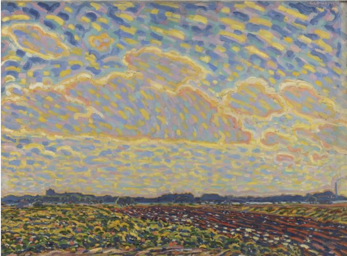
Landschap nabij Montfoort (1909) – Kröller-Müller Museum