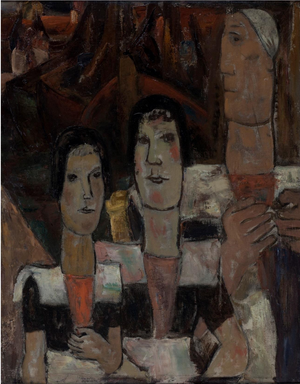
Spakenburgse Vrouwen (1932) – Stadsmuseum Woerden

Hiermee hij refereert aan de delicate evenwichtsbalk tussen traditie en vernieuwing. Enkele jaren geleden is een grote overzichtsexpositie van zijn werk gehouden in het Singermuseum te Laren. Daar blijkt weer eens hoe indrukwekkend het werk van Leo Gestel is, evenals zijn grote invloed op de ontwikkeling van de Nederlandse moderne schilderkunst.