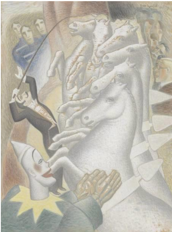
Circus (1928-1929) – Kröller-Müller Museum

Daarna neemt zijn werk weer een andere wending en komt Leo Gestel, onder invloed van schilders als De Chirico en Picasso , in classicistisch vaarwater terecht. In die tijd keren ook nadrukkelijk paarden in zijn werk terug zoals in Circus , dat nu in het Kröller-Müller Museum hangt.