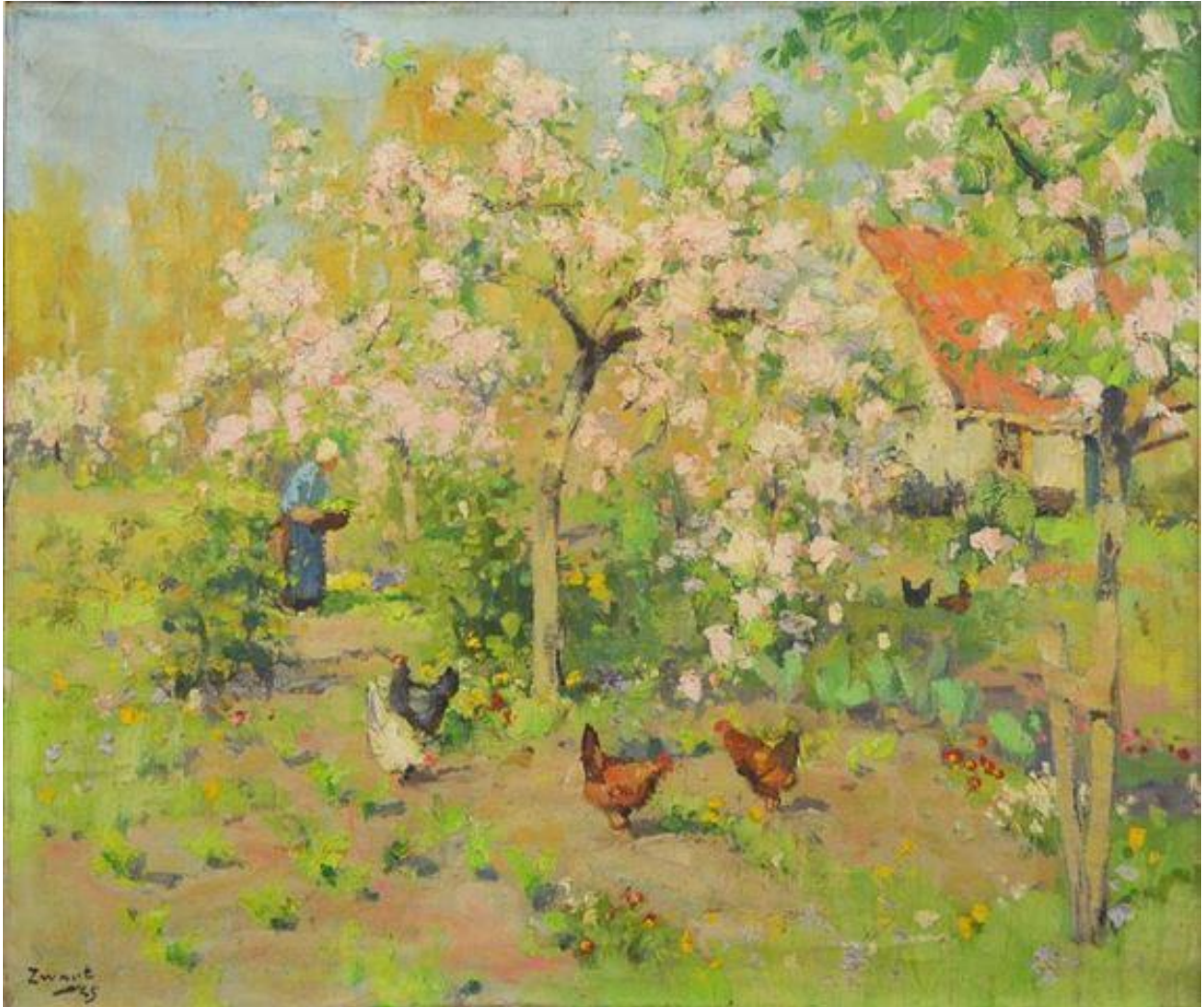
Boomgaard – zonder titel en datum –