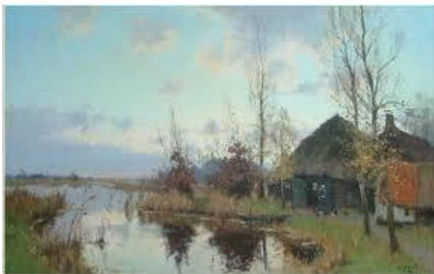
Landschap met boerderij (ca 1955)